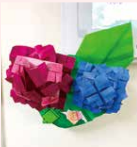
5月:梅雨 あじさいの花と、蛙、かたつむり