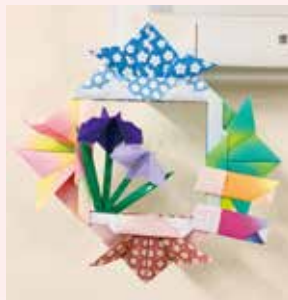
5月:こどもの日 兜のふちに、こいのぼりと菖蒲の花