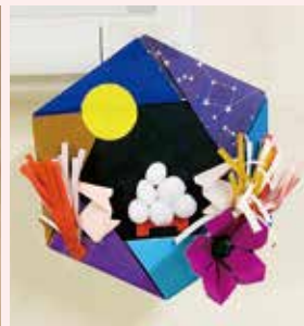
9月:十五夜 うさぎの餅つき

うか、どんな風にしたら喜んでいただけなのか悩みますが、考えて折ることが楽しみのなっています。これからも、患者様が少しでも季節感