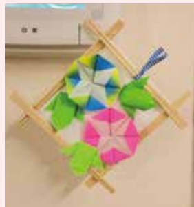
7月:初夏 夏の風物詩 あさがお