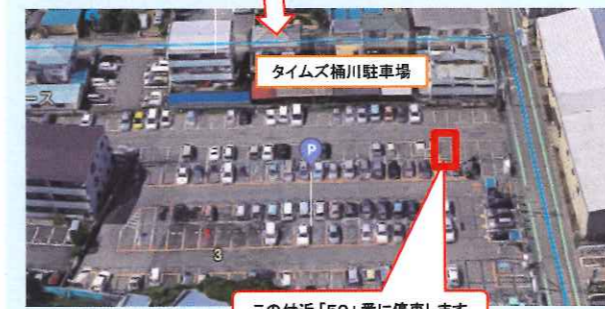
この付近「50」番に停車します